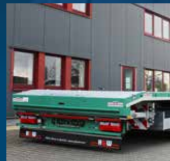
Verlaagde achterkant voor oprijplaten

+49 2564 95095-0 info@hundw-nutzfahrzeuge.de