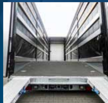
Oplegger met verlaagbare achterkant en oprijplaten

+49 2564 95095-0 info@hundw-nutzfahrzeuge.de