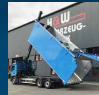
Scheidingsysteem voor het scheiden van groen, bruin en wit glas inclusief hydraulische achterklep