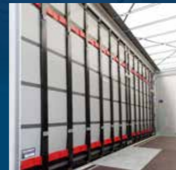
Snel openend Pentawave dekzeilsysteem