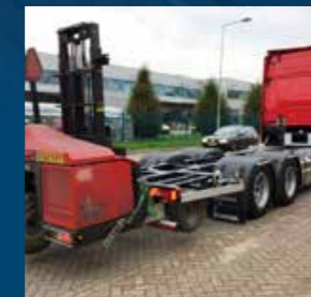
BDF-Wisselframes met aansluiting voor meeneem heftruck