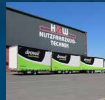
Lange vrachtwagen met injectiesysteem voor isolatiematerialen