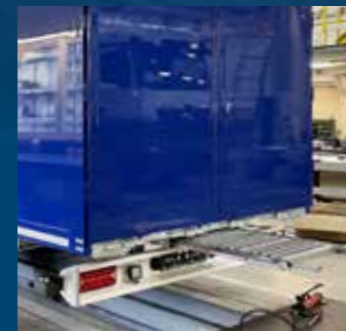
Uittrekktrappen inclusief insteekbare leuning