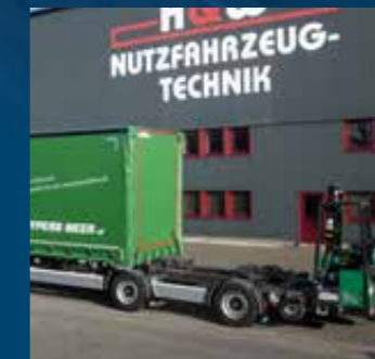
B-Double met constructie voor meeneem hefttruck