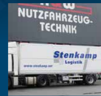
Elektrisch-hydraulisch opklapbare zijwand