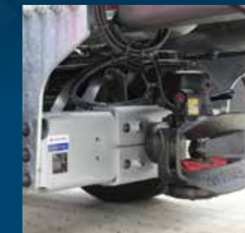
Pneumatisch diepkoppelingssysteem met afstandsdisplay