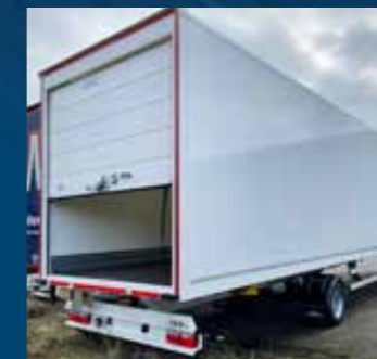
Oplegger met roldeur