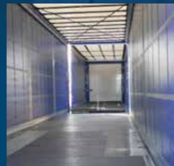
B-Double als doorlader

+49 2564 95095-0 info@hundw-nutzfahrzeuge.de