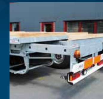
Achterverlenging met rollagers