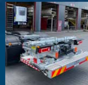
BDF-Wisselframe met laadklep