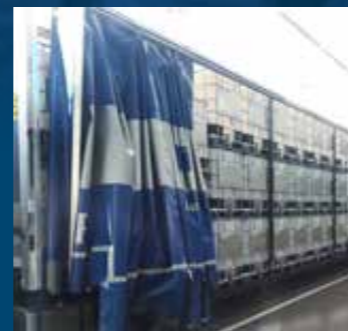
Geoptimaliseerde laadruimte tot 112 lege IBC containers