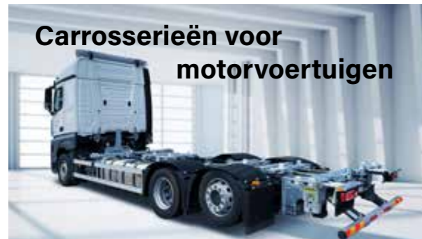
Carrosserieën voor motorvoertuigen

Wij bieden u alles wat nodig is voor het transport van BDF-wisselsystemen. Motorwagens, middenas-aanhangwagens, schamel-aanhangwagens en speciale uitvoeringen. Kies uit het grote aantal verschillende voertuigen en opties. H&W Nutzfahrzeuge biedt u efficiënte BDF-modules welke de flexibiliteit, en daarmee de winstgevendheid van uw transportonderneming, enorm verhogen.