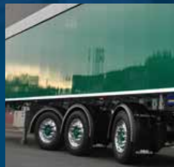
Mechanische gedwongen besturing