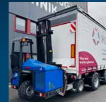
2 assige oplegger met aansluiting voor meeneem heftruck en laadklep