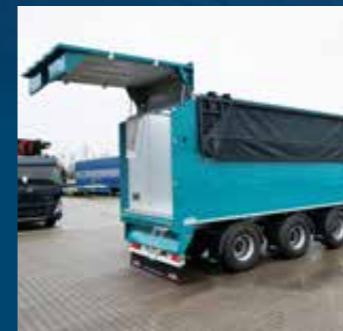
Hydraulische achterklep en afdeksysteem