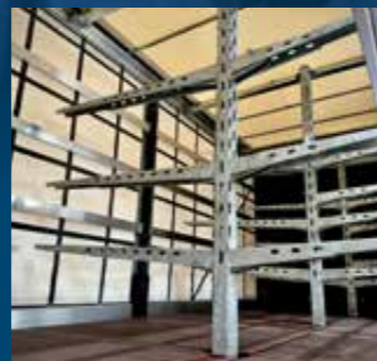
Oplegger met insteekbare stellingen