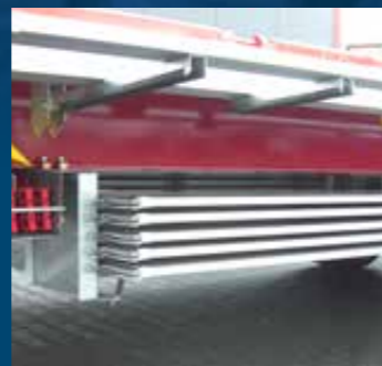
Opbergruimte aan de zijkant