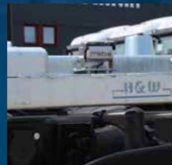
Achteruitrijcamera met sluitert