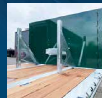
Individuele en flexibele ladingzekeringsystemen