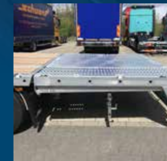
Hydraulisch neerlaatbare achterkant met 5,5 t hefkracht