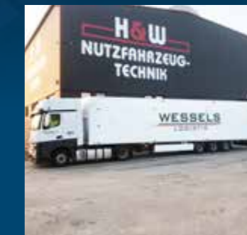
Walking floor aanhangwagen 14.950 mm