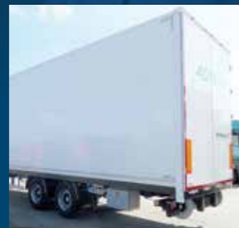
Opname voor dockingstation voor volautomatisch laden en lossen

+49 2564 95095-0 info@hundw-nutzfahrzeuge.de