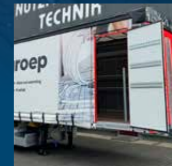
Toegangsdeur in de zijwand