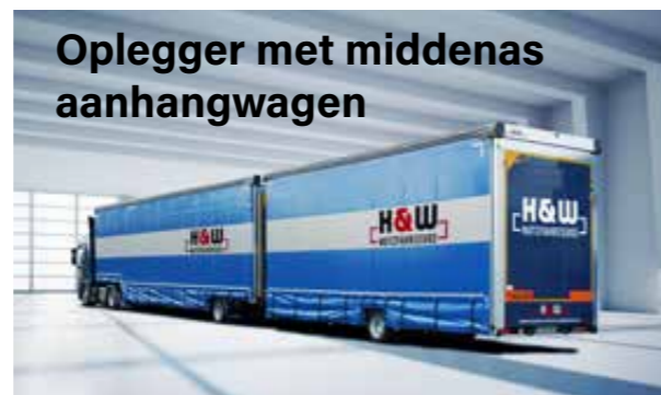
Oplegger met middenas aanhangwagen