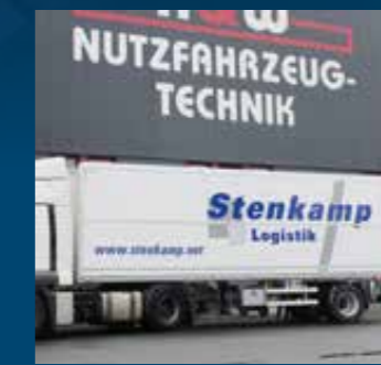
Elektrohydraulisch hochschwenkbare Seitenwand